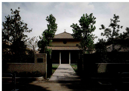
ナザレの家（正面入口）

最後に私の雑感として、講演会などを開いて理解を広める方法だけでなく、専門家でなくとも教会内でその問題を体感している人の話しを聞いた後に、無作為抽出で賛同・反対のグループに分かれて語り合うワークをするのも良い手法かもしれないと考えている。